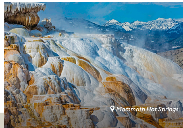
Mammoth Hot Springs

Quittez le parc par l'East Entrance et profitez de la Buffalo Bill Scenic Byway (HWY 14-16-20) pour retourner à Cody, WY (60 min).