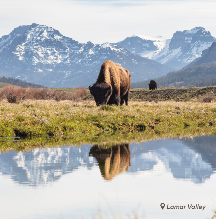
📍 Lamar Valley