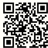
Unterkünfte in Cody Yellowstone