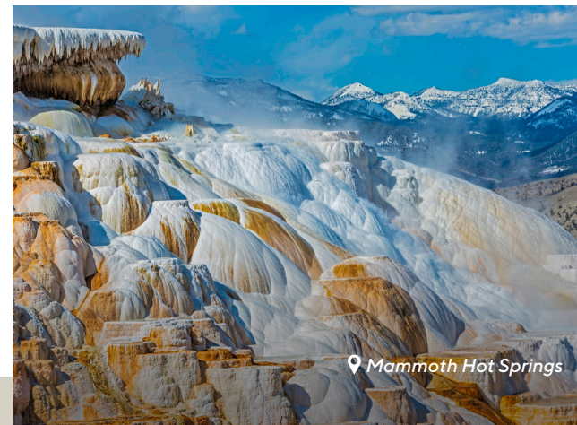
📍 Mammoth Hot Springs

Der Fishing Bridge Complex bietet Gastronomie, einen Souvenirladen, ein Museum und ein Besucherzentrum. Die Straße schlängelt sich am Nordufer des Yellowstone Lake entlang zum Sylvan Pass. Hier genießen Sie hervorragende