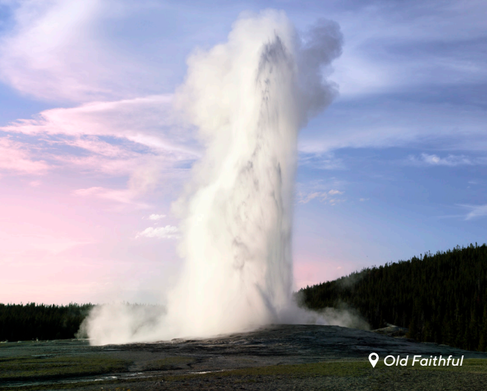
📍 Old Faithful