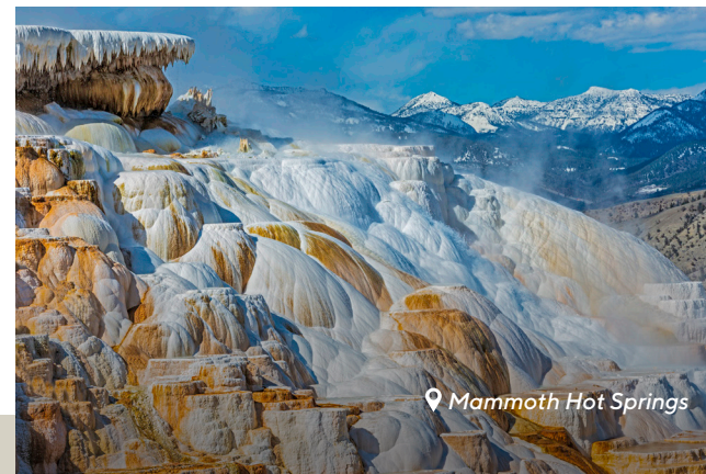
Mammoth Hot Springs

Uscite dal parco attraverso l'ingresso est di Yellowstone e percorrete la bellissima Buffalo Bill Scenic Byway (HWY 14-16-20) fino a Cody, WY. (60 min)