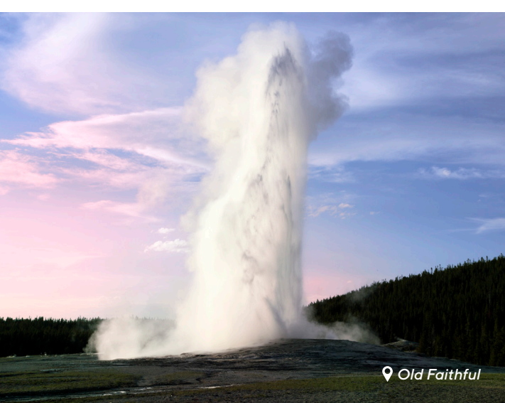
📍 Old Faithful